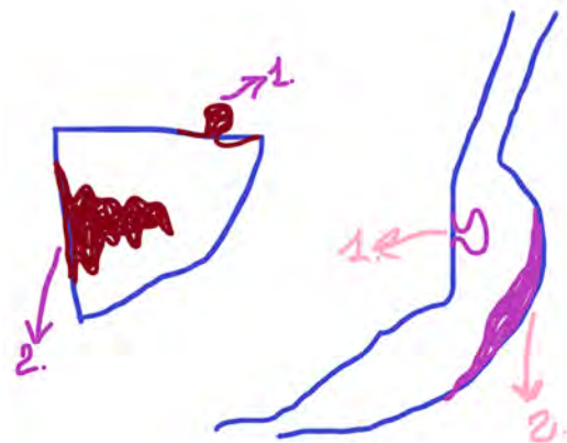
Рис. 3 – Види росту пухлин (технологія візуалізації – скрайбінг)

На рисунку 3 графічно зображено види росту пухлин із циклу тем «Пухлинний процес», а саме практичного заняття за темою «Загальне вчення про пухлини. Морфологічні особливості пухлин з тканин, що походять з мезенхіми» для студентів 3-ого курсу спеціальності «Медицина». Рисунок