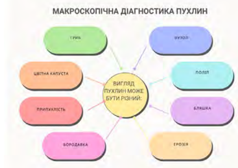
Рис. 1 – Макроскопічна діагностика пухлин (ментальна карта)

На рисунку 1 та 2 структуровано зображено матеріал за допомогою інтелект-карт з предмету патоморфологія, практичного заняття студентів третього курсу спеціальності Медицина на тему «Загальне вчення про пухлини. Морфологічні особливості пухлин з тканин, що походять з мезенхіми».