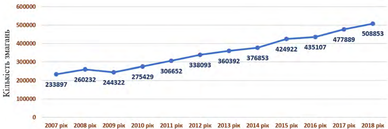
Рис. 3 – Динаміка кількості тренерів Спеціальних Олімпіад у III періоді