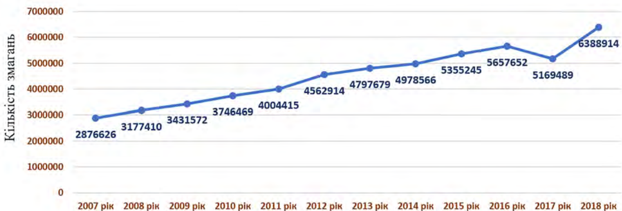
Рис. 4 – Динаміка кількості атлетів і партнерів Спеціальних Олімпіад у III періоді