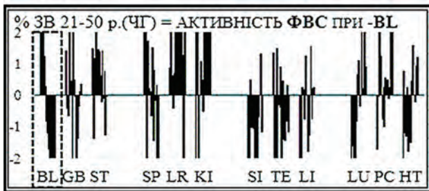
Рис. 2. Системна залежність (динаміка) ФВС при пригніченні BL в чоловічій групі (ЧГ) спостереження

При пригнічені BL, тобто трансформації спрямованої активності ФВС з стану наростаючого збудження на стан наростаючого пригнічення (з "+" на "-", наприкладі ФВС BL) обумовлює зворотну системну залежність. При цьому вона формує аналогічні (зворотні) типи залежних системних реакцій (синхронну, асинхронну і парадоксальну), що свідчить про біофізичну реальність ФВС в цілому і особливості системно-комплексної залежності питань (рис. 2).